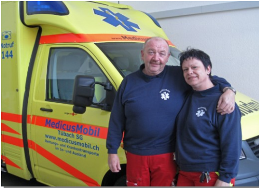
Dipl. Rettungssanitäter HF / Dipl. Pflegefachfrau ( KWS ) und Transportsanitäterin